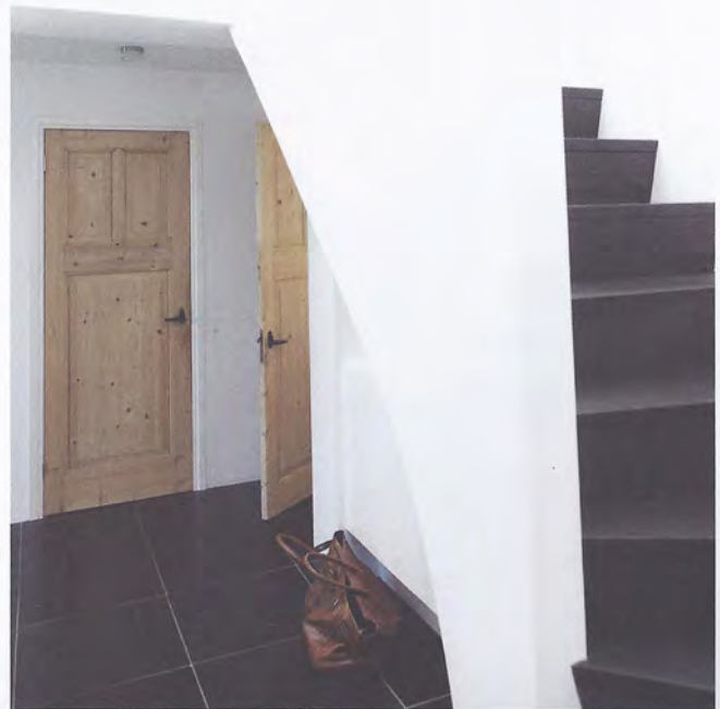
OP DE OUDERSLAAPKAMER OVERHEERST WIT, VAN VLOER TOT EN MET PLAFOND ONTSTAAT ER ZO EEN SERENE LICHTVOETIGE SFEER. OP DE KINDERKAMERS MAG HET DAN WEL KNALLEN.