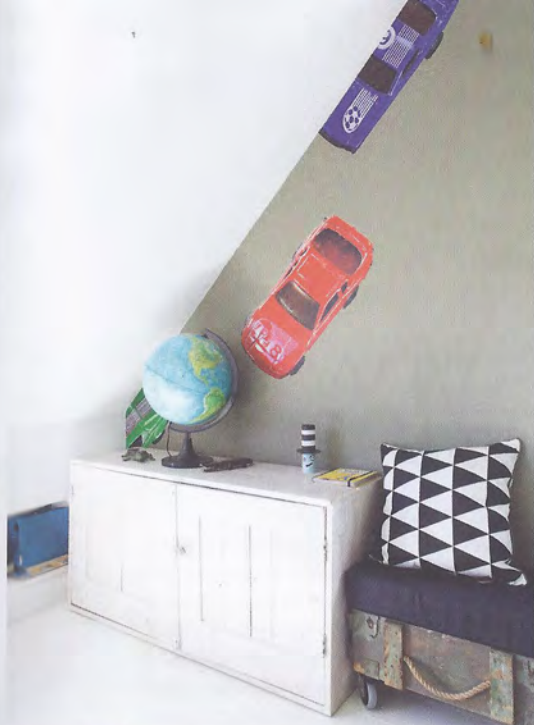
MAND RASMUS, € 22,95.