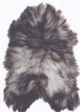
SCHAPENVACHT ISLANDIC, € 174,95.