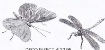
DECO INSECT, € 22,95.