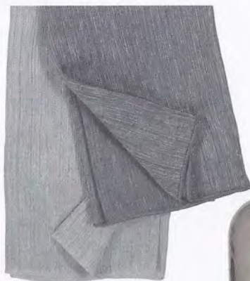
GORDIJNSTOF LICHTGRIJS EN DONKERGRIJS, SAVANNA 17017 EN 17016.